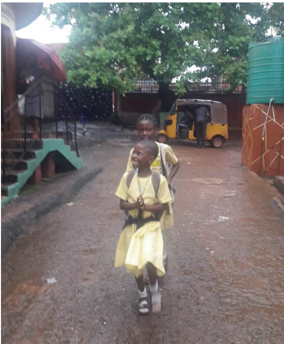
Auf dem Schulgelände

Inzwischen sind etwa 2% der nigerianischen Bevölkerung geimpft. Die Mehrheit der Nigerianer ist gegen eine Impfung. Sie glauben an verschiedene Verschwörungstheorien, Eine davon ist, dass die westlichen Länder sie ausrotten wollen. Die wirtschaftlichen Folgen der Pandemie sind auch hier immens.