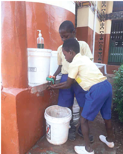
Kinder beim Händewaschen

Das Land hatte in diesem Jahr große Probleme. Der Hauptgrund dafür ist nicht die Coronapandemie sondern die angespannte Sicherheitslage im ganzen Land. Die islamistischen Terroristen „Boko Haram“ im Norden des Landes sind nach mehr als