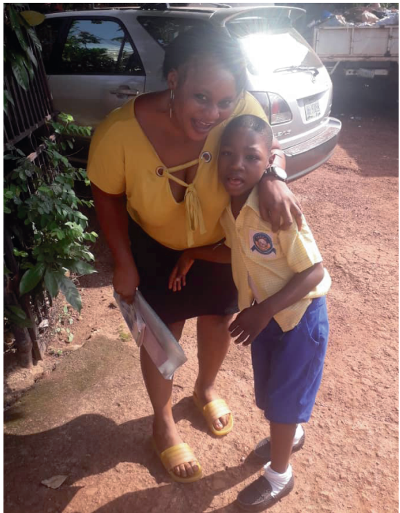
Szene auf dem Schulgelände

In unseren Einrichtungen haben wir trotz vieler Herausforderungen das Jahr bis jetzt gut überstanden. Von Ende Januar bis Ende August, mit kurzen Ferien dazwischen, waren die Schulen in unserem Bundesstaat Enugu geöffnet. Das Erziehungsministerium verordnete diesen Schulkalender, da die Kinder, ihrer Meinung nach, den Lockdown vom Jahr vorher nachholen sollten. Das ist natürlich nicht möglich und am Ende des Schuljahres waren Kinder und Lehrer sehr erschöpft. Ende September fing das neue Schuljahr an und wir hoffen sehr, dass dieses ein normales Jahr ohne Einschränkungen werden wird. Wir haben an mehreren Plätzen im Schulhof Wassereimer aufgestellt, an denen Wasserhähne angebracht wurden. Daneben stehen Seifenspender und Desinfektionsmittel. Unsere Kinder lieben es sich oft die Hände zu waschen und vor allem finden sie die Desinfektionsmittel sehr interessant! Das Tragen der Masken war in unseren Einrichtungen immer ein großes Problem, auch für die Mitarbeiter*innen. Die schwerer Behinderten hatten die größten Probleme mit dem Tragen der Masken. Inzwischen trägt beinahe niemand mehr eine, obwohl auch hier die Pandemie lange nicht vorbei ist.