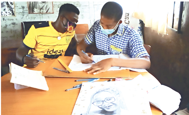
Ein junger Mann mit Autismus, der sehr gut malen und zeichnen kann.