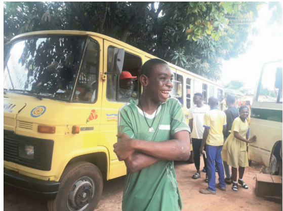
unser neuer Schulbus