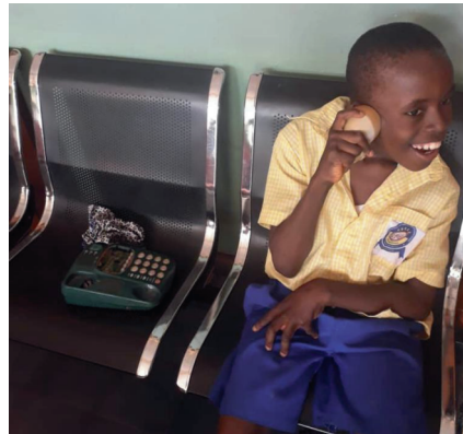
Praktische Tätigkeiten üben